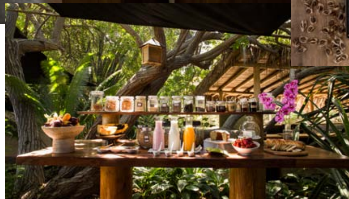
LOS PRODUCTOS ALIMENTICIOS, EN SU MAYOR PARTE, ESTÁN HECHOS CON INSUMOS ORGÁNICOS DE LA ZONA